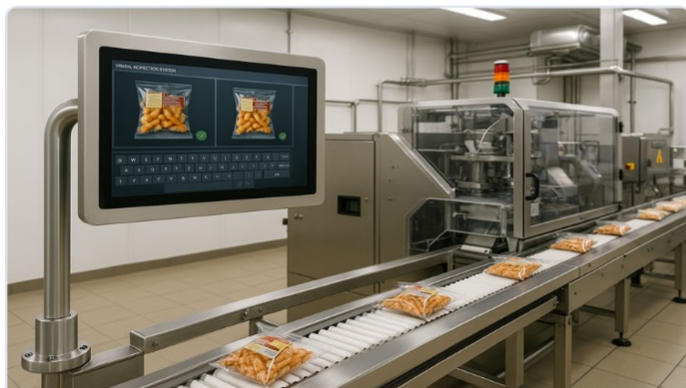
智能包装和视觉检测设备