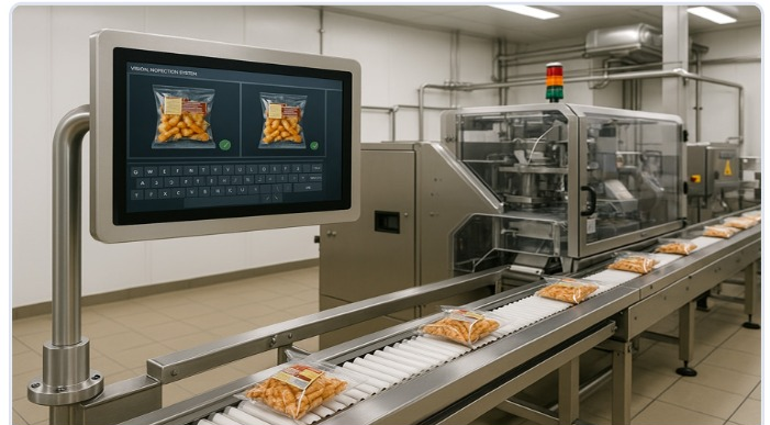
智能包装和视觉检测设备