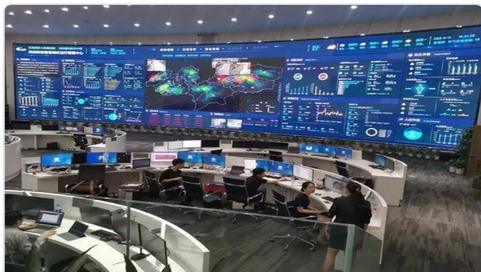
城市运行指挥中心